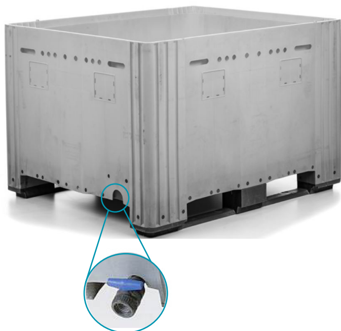
SISTEMA DE COLOCAÇÃO DE TORNEIRA